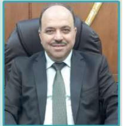
الدكتور تيسر الجراح